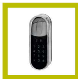
Lecteur Touchpad (code)