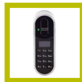
Lecteur Touchpad+ (code et empreinte digitale)